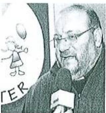
Padre Fortunato Di Noto.

"Lo que me impresiona y lo que, en el fondo, hace la diferencia es que los noticieros, probablemente dirigidos por lobbys de la comunicación, han querido hablar más de esto y no de la gravedad de la criminalidad contra los niños, de la gravedad de la explotación sexual de los niños, de la gravedad del turismo sexual infantil, de la gravedad de la venta de niños y la gravedad de la violación de niños. Esta es la demostración visible y espectacular de cómo, algunos medios de comunicación, movidos por algunos lobbys de pensamiento, comunican, a veces, noticias falsas, no verificables o incluso manipuladas".