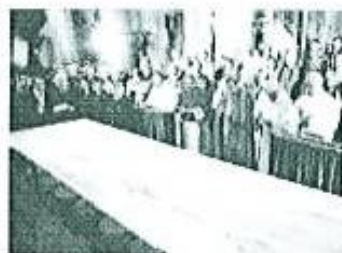
La Sábana Santa estará de gira y llegará a Perú.

Según informan los organizadores, además del congreso se "realizará una jornada especial para religiosos, sesiones especiales para profesores y estudiantes de colegio, y una gran exposición temática sobre la Sábana Santa que contempla la historia, los diversos estudios realizados, las teorías de la formación de la imagen, como unas reproducciones fotográficas al ta-